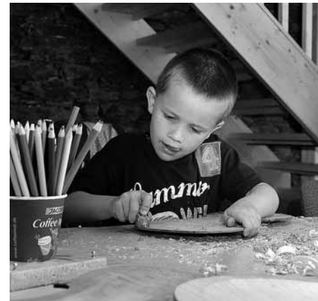
Kleiner »Geigenbauer« zum Museumstag 2007 im Musikinstrumenten-Museum Markneukirchen

Sie bewahren und vermitteln das kulturelle Erbe der Menschheit und geben mit ihren Beständen umfassende Einblicke in die gesellschaftliche Entwicklung von ihren Anfängen bis zur Gegenwart: in das Leben und Wirken des Menschen, in das Leben in der Gemeinschaft ebenso wie in die privaten Aspekte der Lebensgestaltung, in schöpferische Leistungen und gesellschaftliche Entwicklungen. Besondere Bedeutung nimmt dabei der Aspekt der kulturellen Vielfalt ein.